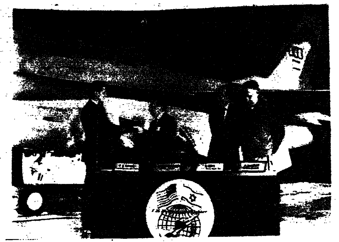
حفل تسليم اول طائرة من طراز ( اف - 16 ) الى سلاح الجو الاسرائيلي الذي جرى في احد القواعد الجوية في تكساس - وشاهد في الصورة الجنرال جيسس ابراهامسون والجنرال اريه كيني مندوب وزارة الدفاع الاسرائيلية في واشنطن.